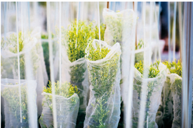
In het onderzoekslab van zaadveredelingsbedrijf Rijk Zwaan in het Brabantse Fijnaart vernieuwen onderzoekers voortdurend de 900 verschillende groenterassen waarvan het bedrijf wereldwijd zaden verkoopt.

beschouwd", verklaart onderzoeksleider Richard Visser, hoogleraar Plantenveredeling op de Wageningen Universiteit. "Er zit immers geen DNA in dat er niet van nature ook in zou kunnen zitten." Visser ziet ook een praktisch probleem: als de rassen qua DNA hetzelfde zijn als 'gewone' rassen, is niet is te controleren of bedrijven die technieken wel of niet hebben gebruikt.